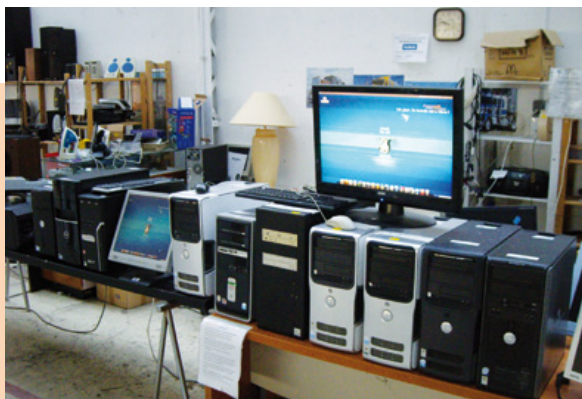
Espace vente de machines reconditionnées sous Emmabuntüs dans la communauté Emmaüs Liberté d'Ivry sur Seine.

Nous avons aussi des projets de collaboration dans le domaine du reconditionnement avec les associations : Les Amis de la Terre ( http://www.amisdelaterre.org/ ), Festival de la Récup ( http://festivaldesutopiesconcretes.org/recup-idf-2013/ ), AMELIOR ( http://amelior.canalblog.com/ ) et e-nexus ( http://e-nexus.net/ ).