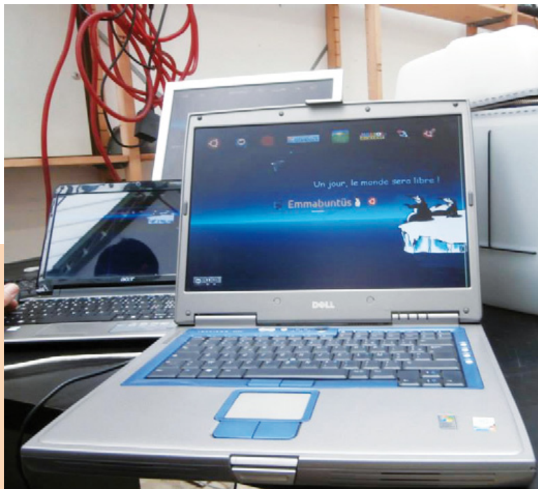
Ordinateur portable reconditionné sous Emmabuntüs.