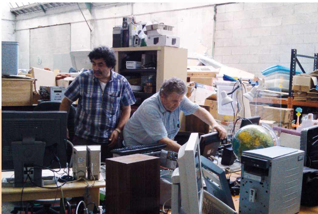
Un atelier de reconditionnement (Emmaüs Liberté d'Ivry sur Seine)

Pour la formation au reconditionnement d'ordinateurs vers les associations, mais aussi les particuliers, nous avons mis en place avec le projet Jerry Do-It-Together [6] un atelier de formation basé sur la fabrication de Jerry. Cet atelier de formation a eu la chance d'être accueilli par le FacLab de Gennevilliers en avril 2013, il a lieu tous les mardis de 14h00 à 18h00.