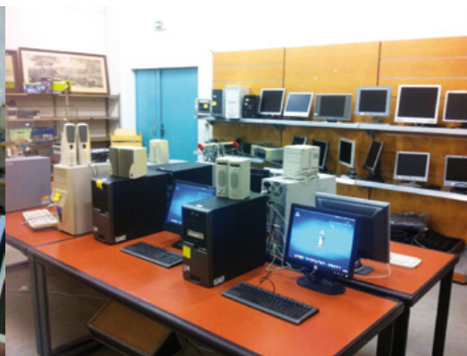
Vente d'ordinateurs sous Emmabuntüs (Emmaüs Cabriès)